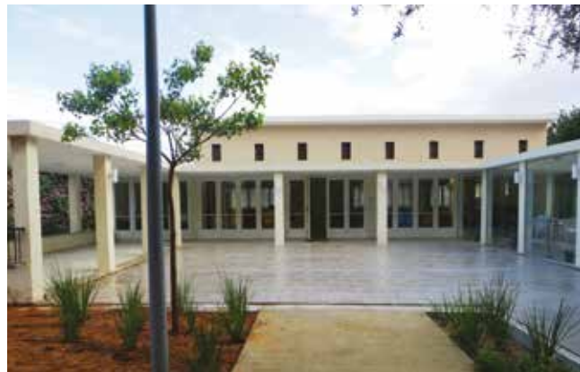
בית התרבות כיום. צילום: רינה רייניץ-אידן, 2016

תולדות הקמתו של מתחם הזיכרון והתרבות בכפר הס והתפתחות תפקודיו השונים לאורך השנים מייצגות את המפגש בין תפקידים של מונומנטים שנועדו להנצחת זיכרון של קהילה לבין תרומתם הפרקטית לקיום חיי קהילה. המתחם נועד להנציח את זיכרון האירוע הטראומתי שהתרחש בשלהי שנות הארבעים והשפיע במהלך השנים על קהילת המושב כולה, ובו בזמן לשמש את חיי היום-יום של המושב, את הצרכים והתפקודים המיוחדים אותו. השניים משתלבים זה בזה ומאפשרים למרחב הציבורי המורכב מסוכני שכול (אנדרטה וגן זיכרון) וממבני קהילה (בית תרבות, ספרייה, מזכירות ושטח פתוח מעוצב) להתקיים לאורך זמן. כך, גם כאשר הקהילה משנה את פניה, את רצונותיה ואת צרכיה, מוסיף מרחב משותף זה לייצגה ולהדגיש את ייחודה.