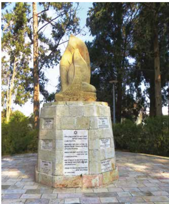
אגדרטת הזיכרון. פיסול מרדכי כפרי.