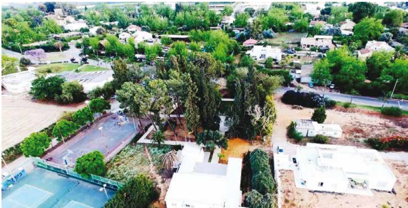
תצלום אוויר של המרכז המדומה של כפר הס, ובמרכזו גן המגנים ובית התרבות.