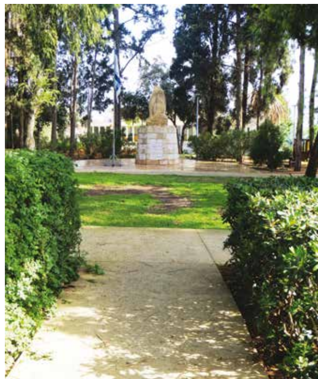
פינה בגן המגנים.