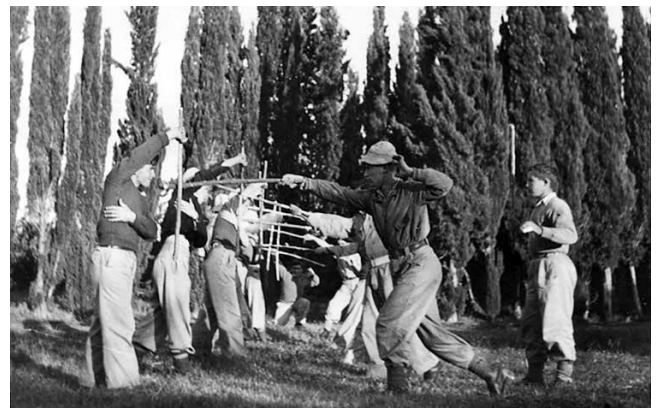
אימוני הפל"מ המקומי.

ביום 13 בחודש מאי נפלו 24 מבנינו בפעולה נגד הכפר טירה. ארבעה מבנינו נעדרים עד היום [הנעדר הנוסף היה בן מושב עין ורד הסמוך, ר"א]. אנו משוכנעים כי פעולה זו שהביאה אסון כה