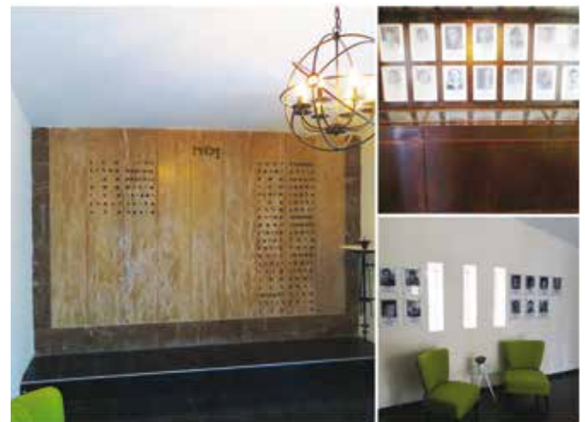
חדר הזיכרון מכפנים.