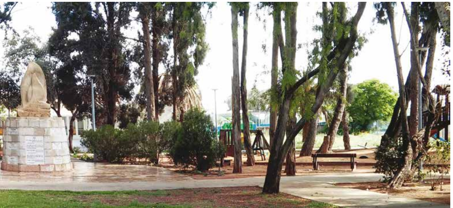
המכלול של גן המגנים ובית התרבות.

סביב הנושא, והפסיכולוגיה מלמדת אותנו שסיפור אשר "אינו מסופר" מפעיל את בעליו בצורה יעילה יותר מאשר סיפור מסופר (בר-און, 1982). לכפר הס נדרשו חמישים שנה עד שבטקס יום הזיכרון סיפרו לראשונה לוחמים שהשתתפו בקרב לכלל הציבור במושב את אשר עבר עליהם באותו אירוע.