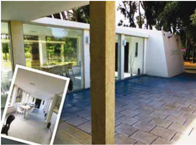
שביל הזיכרון.